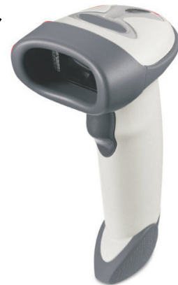
ΑΝΑΓΝΩΣΤΗΣ BARCODE ΣΕΙΡΙΑΚΟΣ RS-232