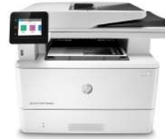
HP LaserJet Pro MFP M428fdw

Ο συγκεκριμένος εκτυπωτής χρησιμοποιεί δυναμικό μοντέλο ασφαλείας, το οποίο μπορεί να ενημερώνεται κατά περιόδους μέσω ενημερώσεων υλικολογισμικού. Μόνο δοχεία με αυθεντικό chip της HP πρέπει να χρησιμοποιούνται στον εκτυπωτή. Τα δοχεία που δεν χρησιμοποιούν chip της HP μπορεί να μην λειτουργούν ή να σταματήσουν κάποια στιγμή να λειτουργούν. Περισσότερα στη διεύθυνση: Μάθετε περισσότερα στη διεύθυνση: www.hp.com/learn/ds