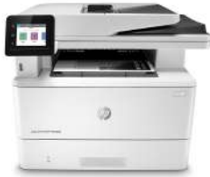
HP LaserJet Pro MFP M428fdn

Η πρωτοπορία στις επιχειρήσεις απαιτεί πιο έξυπνο τρόπο εργασίας. Ο πολυλειτουργικός εκτυπωτής HP LaserJet Pro M428 έχει σχεδιαστεί ώστε να σας επιτρέπει να διαθέτετε τον χρόνο σας εκεί που είναι πιο παραγωγικός – στην ανάπτυξη της επιχείρησής σας και τη διατήρηση της πρωτοπορίας σε σύγκριση με τον ανταγωνισμό.